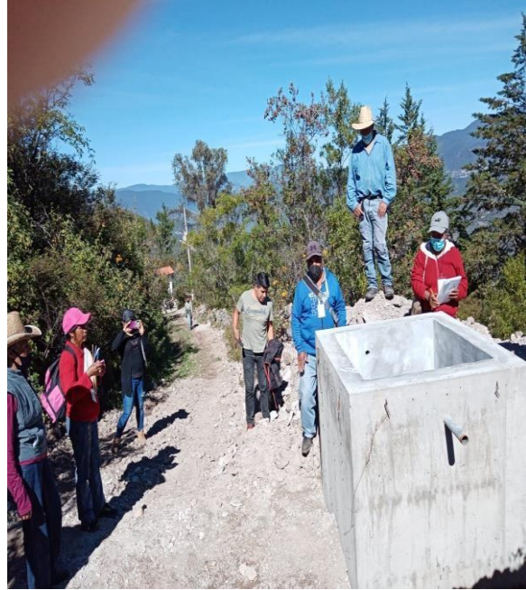
COMITÉ DE CONTRALORÍA SOCIAL DE SANTA CATARINA LACHATAO