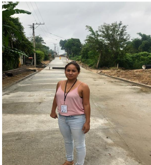
COMITÉ DE CONTRALORÍA SOCIAL DE SANTA MARÍA HUATULCO